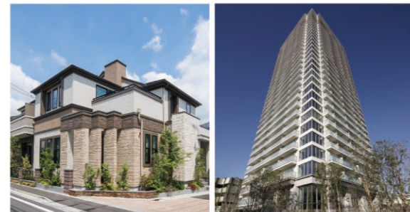
リーフィア世田谷桜

分譲ブランド「LEAFIA」は、用地取得、商品企画から販売、アフターサービスまで一貫した体制で、まちづくりを行っており、末永くお客様の住生活をサポートします。