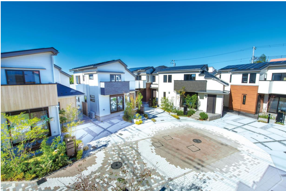
リーフィア狛江 蒼翠の街 街区中央のPLAZA（クルドサック）

現在、小田急グループでは持続可能な成長を沿線地域とともに実現していくため、お客さまと共に子どもたちを育む沿線づくりを推進しています。小田急グループにおける不動産中核会社である当社は、小田急電鉄が掲げる「子育て応援ポリシー」に賛同し、今後も東京・神奈川エリアにおいて長く快適に住み続けられる住まいとして、自社新築分譲住宅「リーフィア／LEAFIA」シリーズを展開してまいります。