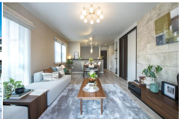
リーフィア狛江 蒼翠の街 内観写真（LDK）