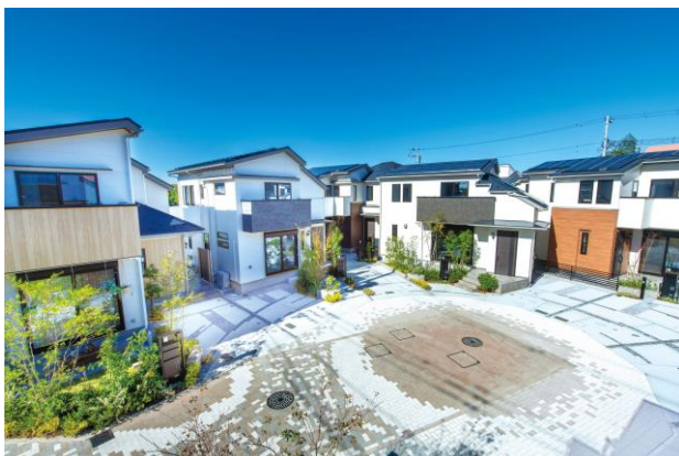
リーフィア狛江 蒼翠の街 街区中央のPLAZA（クルドサック）

<キッズデザイン賞WebサイトURL> https://kidsdesignaward.jp/