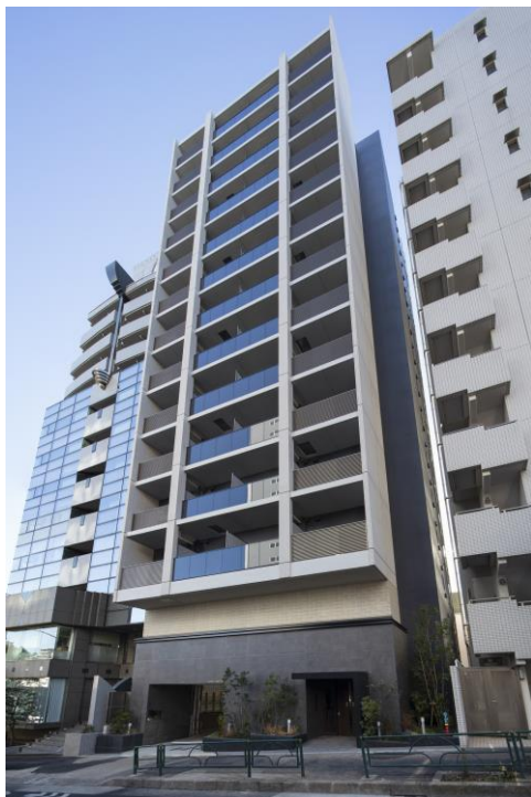
< 外 観 >

当社では、2029年度までに「賃貸資産規模1,000億円」を目指し、更なる事業拡大に向け精力的に取り組んでおり、今後も小田急沿線、東京都心部等を中心に、積極的に優良賃貸資産への投資を行ってまいります。