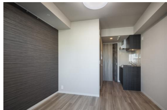
< 上：EVホール 下：専有部 >