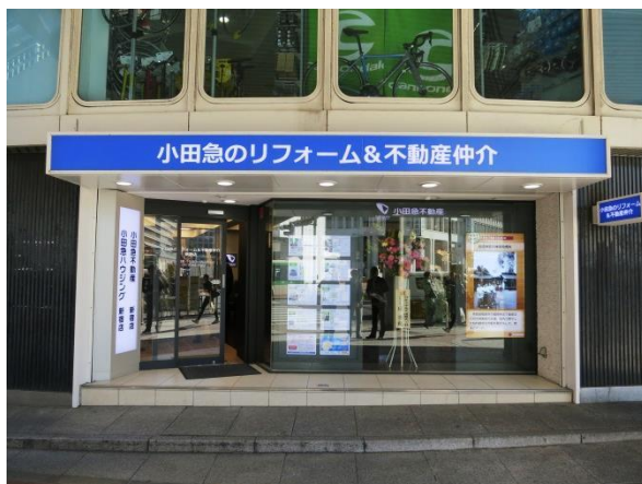
< 店舗外観 >

今後も、小田急不動産および小田急ハウジングは、中古住宅やリフォームに関するあらゆるニーズにワンストップでお応えできるよう、更なるサービスの拡充に努めてまいります。