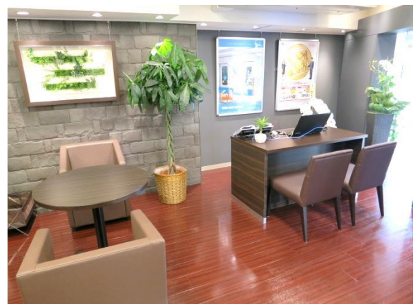
< 店舗内観 >