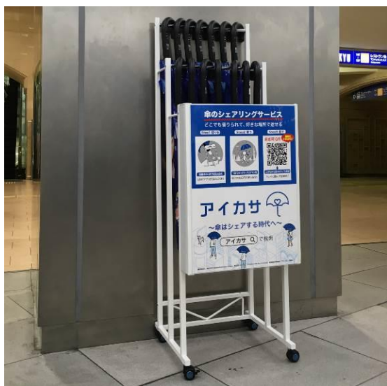
アイカサ専用傘立て（イメージ）

今後は、本試験運用における利用状況等を検証し、小田急線沿線における運用の拡大を目指していきます。