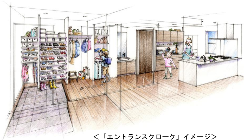
<「エントランスクローク」イメージ>

本物件は、「くつろぎのイエジカン」をテーマに、家事の時間を短縮する「イクカジスタイル」、共働きママ向けの「スマジヨスタイル」、パパが趣味を満喫できる「パパ充スタイル」の3つのライフスタイルを、共働きファミリーのための20項目の新発想空間「IDEA20」の要素を組み合わせて提案しています。