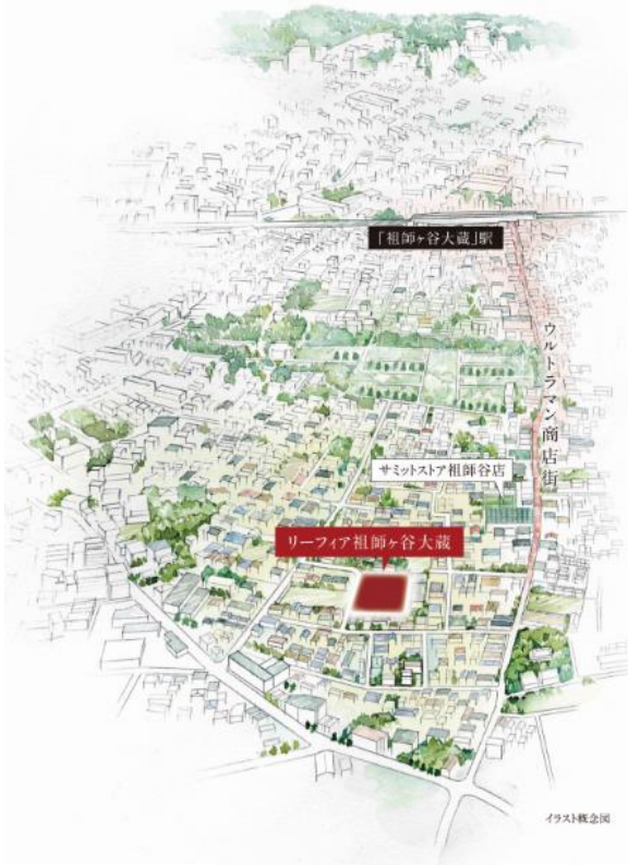
<周辺エリアイラスト>

本物件は、ウルトラマン商店街から程近い閑静な住宅街にある約2,400㎡の敷地を開発して誕生します。「悠久の邸宅」をコンセプトにモダンでスタイリッシュなデザインを採用し、建物の外観には切石素材やタイルを使って重厚感を演出しています。外構には大型の門扉やコーナーウォールを組み合わせ、立体感を感じさせるプライバシー性の高いセミクローズ外構を取り入れました。また、デザイン性の高いインターロッキング舗装の開発道路に連続したデザインを取り入れたカーポートを組み合わせ、1邸1邸が美しく調和し洗練された街並みを創出しました。