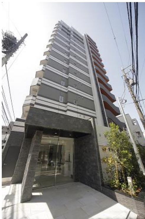
< 外 観 >

当社では、今後も小田急沿線および東京都心部等を中心に、積極的に優良賃貸資産への投資を行ってまいります。