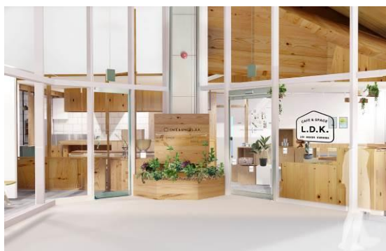
栗平駅「CAFÉ &amp; SPACE L.D.K.」(イメージ)

なお、両施設は働き方改革を見据えた新しいライフスタイルにつながる可能性がある点が評価され、国土交通省により「平成30年度スマートウェルネス住宅等推進モデル事業（住宅団地再生部門）」に採択されました。小田急グループが住宅供給を担ってきたエリアの価値向上のため、多世代交流による地域への愛着醸成・活性化を目指し、ライフスタイルに応じた価値を提供する拠点の整備を目指してまいります。