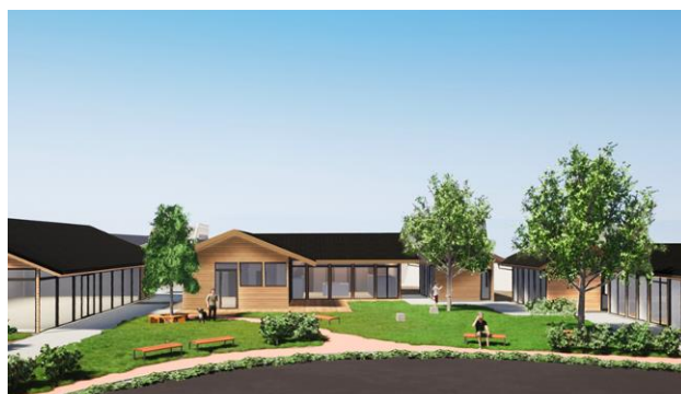
黒川駅「ネスティングパーク黒川」(イメージ)